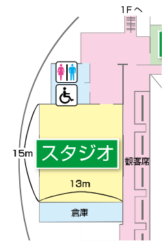
平面図 体育館 2F