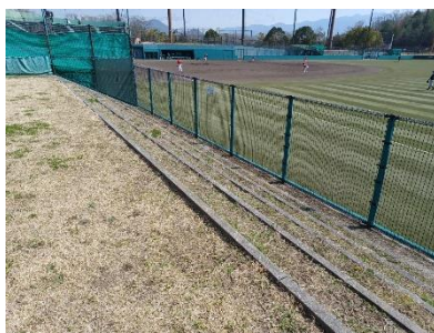
外野観覧スペース