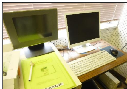
スコアボード 入力機器