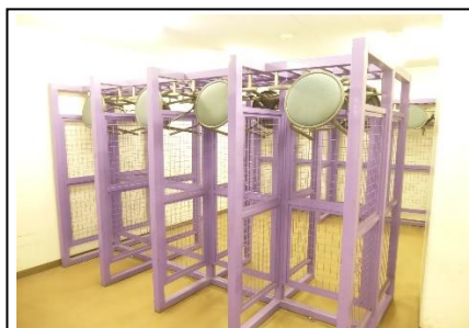
ロッカールーム(無料)