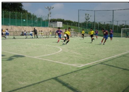
フットサルコート(1番)